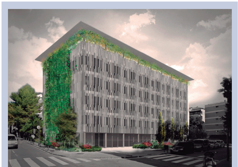
Maqueta del nuevo centro sanitario del Grupo ASISA en Barcelona.

En este sentido, el nuevo edificio del Grupo ASISA en Barcelona permitirá la instalación de nuevos servicios de atención primaria y especializada (ginecología, oftalmología, dental, radiología, laboratorio, etc.).