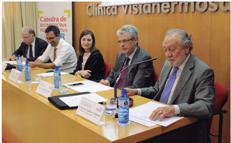
Miembros de Comité de Bioética de ASISA-Lavinia durante una jornada formativa.

Para desarrollar estas líneas estratégicas, ASISA y UNESCO Chair in Bioethics