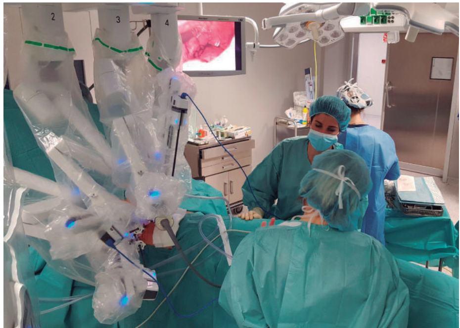
La lobectomía robótica realizada en HLA permitió dar el alta a la paciente en tres días.