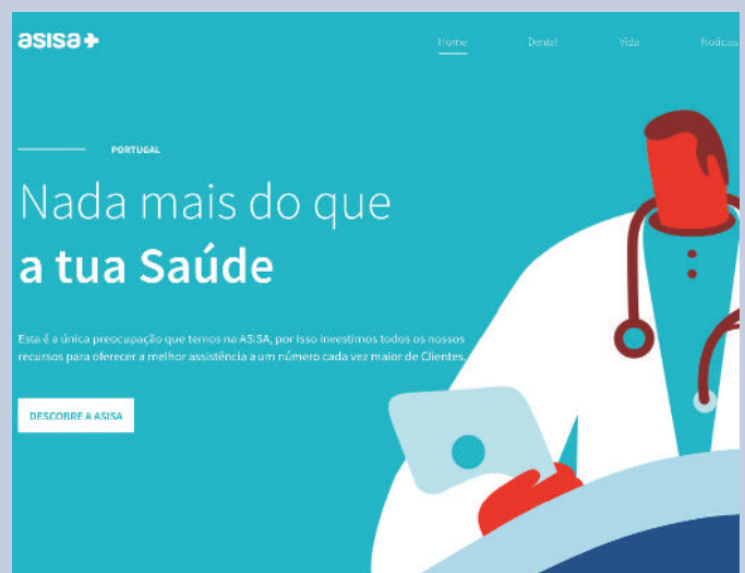
Imagen de la nueva web de ASISA Portugal.

Además, para reforzar su actividad comercial, ASISA Portugal acaba de renovar su página web ( www.asisa.pt ).