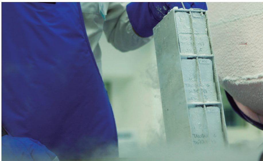
Bio-Cord conserva más de 55.000 unidades de sangre del cordón umbilical.

Extraer estas células es muy sencillo en indoloro tanto para la mamá como para el recién nacido y se realiza en el momento del parto, por ello, si vas a preservar las células de tu bebé se recomienda contratar este servicio dos meses antes de la fecha de nacimiento previsto y no olvidar llevar el kit de recogida células madre al hospital el mismo día del parto, que entregaréis al equipo médico que os atenderá.