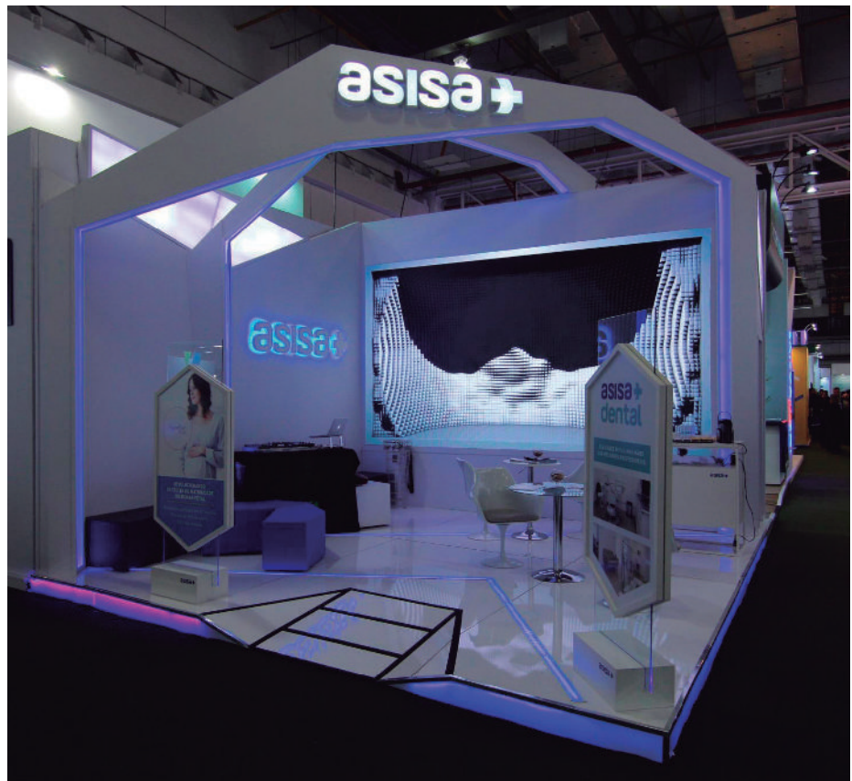
Imagen del stand de ASISA en Hospitalar 2018.

Brasil constituye una gran oportunidad para el Grupo ASISA, por tratarse de un mercado de gran tamaño, con margen para la innovación y en el que la compañía puede trabajar con socios que comparten modelo cooperativo.