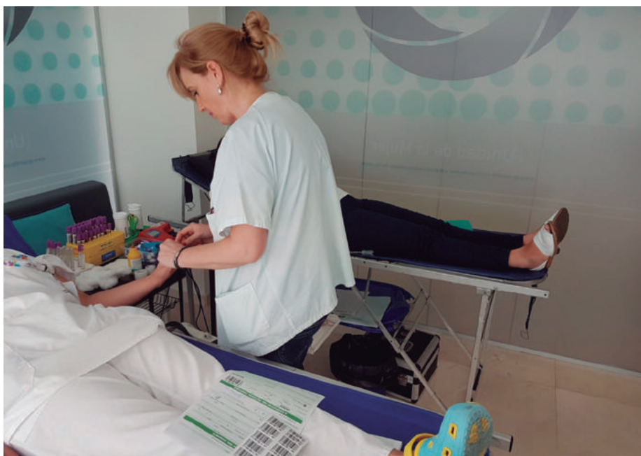
Los cinco centros de HLA que participaron en la campaña junto a los centros locales de hemodonación recogieron 217 bolsas de sangre.

Los hospitales HLA San Carlos en Denia, HLA La Vega de Murcia, HLA Universitario Moncloa de Madrid, HLA Inmaculada en Granada y HLA Los Naranjos de Huelva han conseguido superar su récord en donaciones de sangre colaborando con los centros de hemodonación de sus ciudades. Lo hicieron durante el Día Mundial del Donante de Sangre, cuando recogieron 217 bolsas de sangre con las que se podrán salvar o ayudar a mejorar la vida de hasta 651 personas.