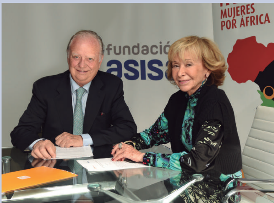
El Dr. Ivorra junto a la presidenta de la Fundación Mujeres por África, Mª Teresa Fernández de la Vega, durante la firma del acuerdo.

La Fundación Mujeres por África y la Fundación ASISA han suscrito un convenio marco con el fin de trabajar juntas en el ámbito de la salud pública. Ambas instituciones colaborarán en proyectos conjuntos para contribuir al logro del Objetivo 3 de Desarrollo Sostenible: garantizar una vida sana y promover el bienestar, e impulsarán acciones en el ámbito de la salud materno-infantil en África y promover el conocimiento, formación e investigación en áreas relacionadas con la salud, especialmente en todo lo vinculado con las mujeres.