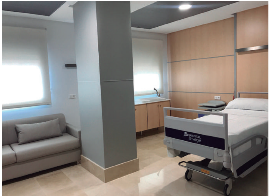
Las 17 habitaciones son exteriores, están conectadas con el servicio de enfermería y cuentan con un mueble cambiador con bañera.

El Hospital HLA La Vega (Murcia) continúa la ampliación y renovación integral de sus instalaciones. La última zona que ha abierto ha sido la planta materno infantil, ubicada en la sexta planta del complejo hospitalario y que cuenta con 17 nuevas habitaciones individuales, dos de ellas suites con sala privada para familiares, y una amplia zona de UCI Neonatal. Todas las habitaciones disponen de un sistema de comunicación permanente con enfermería para asegurar la atención de la madre y el recién nacido en el menor tiempo posible, cuentan con un amplio sofá para acompañantes y mueble cambiador con bañera, para que el recién nacido no tenga que abandonar la habitación. La nueva unidad cuenta además con una amplia zona de cuidados intensivos neonatales, garantizando la atención temprana ante cualquier complicación y la más avanzada tecnología para el cuidado del bebé. Asimismo, la nueva planta materno infantil cuenta con un equipo de ginecología y pediatría con presencia física las 24 horas del día.