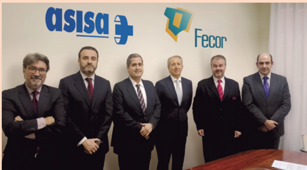
Los representantes de Fecor y ASISA, tras el acto de firma por el que ASISA se incorporó al Grupo de Apoyo de Fecor.

el canal de corredores de seguros. Este grupo tiene entre sus principales objetivos fomentar y divulgar la figura del corredor y de la correduría de seguros. La incorporación de ASISA permitirá su acercamiento a las distintas organizaciones integradas en Fecor.