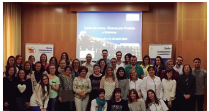
Miembros del Área de Enfermería del Grupo Hospitalario ASISA que participaron en la primera edición del Curso de Curas.