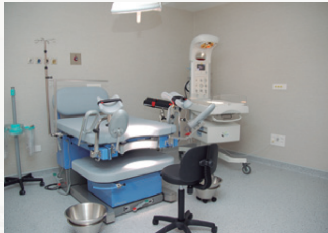
Nuevo paritorio de Clínica Montpellier, dotado de la última tecnología para garantizar la mejor atención.

Entre los servicios que ofrece el centro hospitalario a las mujeres se encuentran: consultas externas; Urgencias de Ginecología y Obstetricia 24 horas; seguimiento de embarazo, parto y lactancia; medios diagnósticos punteros (mamografía digital+tomosíntesis, densitometría y ecografía); tratamientos de reproducción asistida e