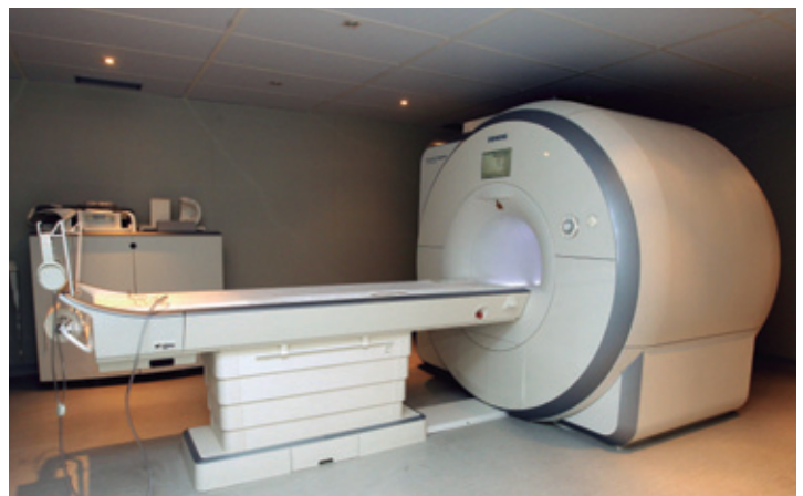
La nueva resonancia magnética de Moncloa emplea la tecnología TIM (Total Imaging Matrix) 4G, la más avanzada del mercado.

El nuevo equipo permitirá ampliar los recursos tecnológicos del hospital que, actualmente, se sitúa a la vanguardia tecnológica de nuestro país contando con un TAC de 64 cortes; dos resonancias magnéticas nucleares (1,5 y 3 Teslas); un arco radio quirúrgico para Cirugía Cardíaca, Neurocirugía y Cirugía Vascular; un arco radio quirúrgico para Radiología Vascular intervencionista y Hemodinámica; dos arcos radio quirúrgicos para Electrofisiología Cardíaca y tratamiento de arritmias; un telemando digital; equipos de radiología convencional y de radiología portátil; mamógrafos; y un ortopantomógrafo, entre otros.