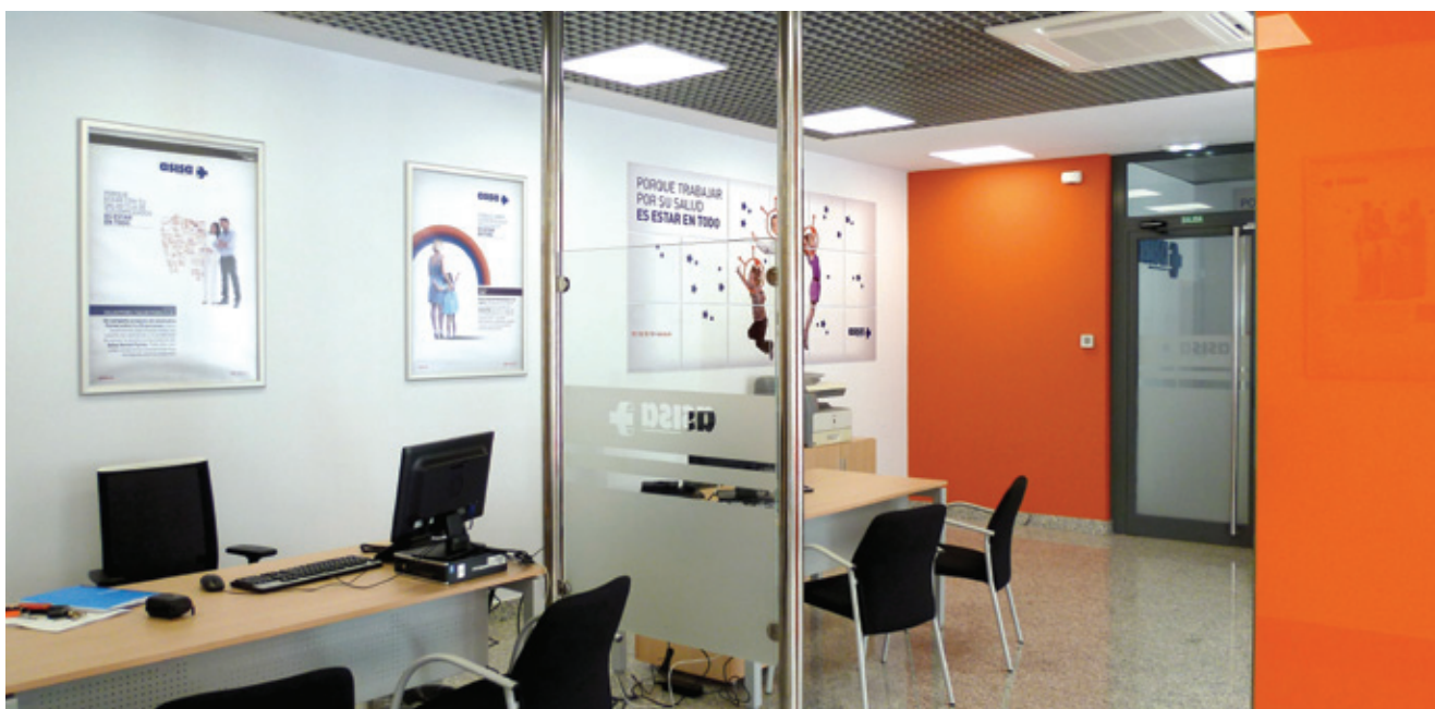
En Gijón, ASISA ha abierto su oficina en la calle Ruiz Gomez, 4, junto a la Plazuela de San Miguel.

que amplía tanto el número de profesionales como los centros que hasta ahora venían prestando sus servicios a los asegurados. Con esta ampliación, se incorporan más de 200 nuevos profesionales sanitarios lo que permitirá a ASISA contar con el cuadro médico más completo del Principado, que incluye más de 1.200 facultativos y los principales centros privados de referencia.