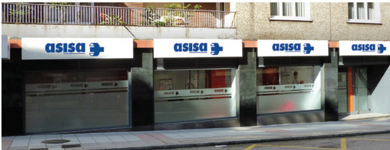
La oficina de Oviedo está situada en Alférez provisional, 11, esquina avenida Galicia, 9.

Se amplía el cuadro médico en el Principado, que contará con más de 1.200 facultativos y los principales centros privados de referencia