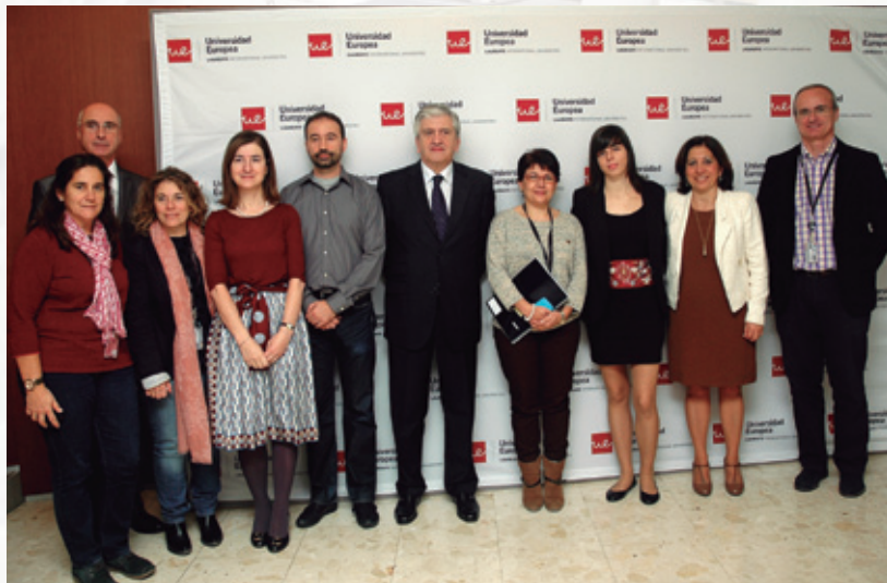
El Dr. De Porres junto a los premiados y los responsables de la Cátedra ASISA-Universidad Europea

ASISA ha entregado los premios de las Cátedras que mantiene con la Universidad Autónoma de Madrid (UAM) y con la Universidad Europea y que reconocen a los alumnos e investigadores que realizan una labor destacada en el ámbito de las Ciencias de la Salud.