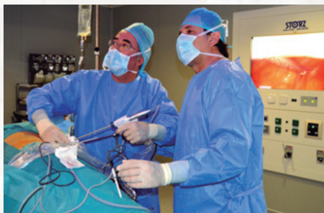
Intervención por laparoscopia en los nuevos quirófanos de La Vega

Además, únicamente precisa un día de hospitalización, a las 24 horas se puede recuperar la actividad normal y, lo más relevante, consigue que el dolor desaparezca de forma inmediata y para siempre.