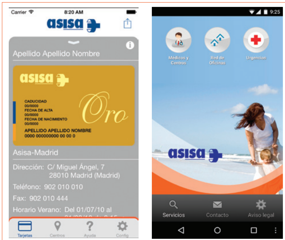
La nueva aplicación móvil de ASISA es intuitiva y sencilla de utilizar.

Toda la información sobre esta nueva aplicación se puede encontrar en: www.asisa.es/app-asisa .