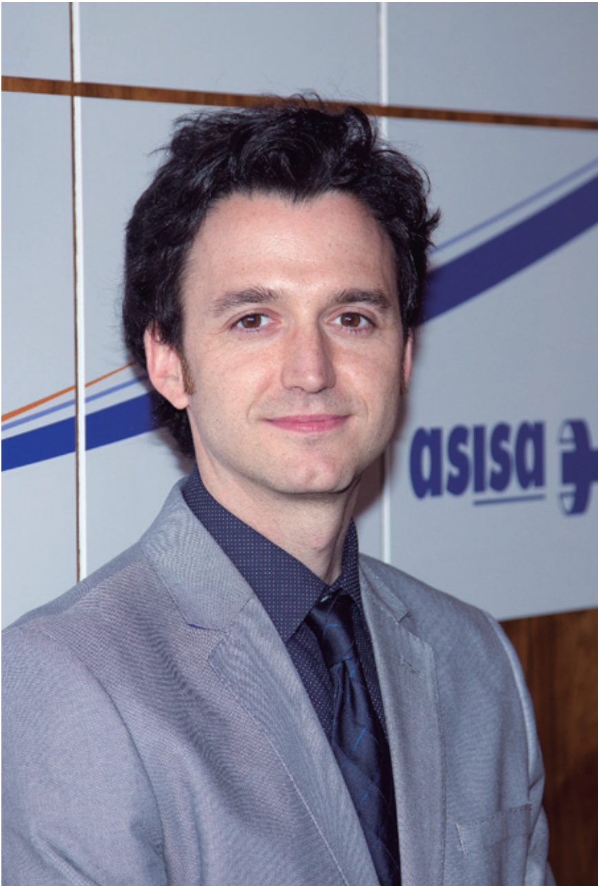
Dr. Xabier García-Albéniz.

los fármacos, o incluso preguntas que se hace el paciente pero que no se hace el médico. En investigación hay que integrar todo; en Estados Unidos esto ya se ha reconocido desde hace 4 ó 5 años y ya han creado una institución que va a financiar este tipo de investigación más centrada en el paciente.