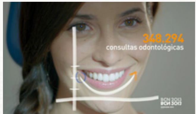
Imagen de la campaña de publicidad de ASISA.

“Nuestro beneficio es tu salud” ha estado presente en televisión, radio, prensa escrita, internet y medios exteriores