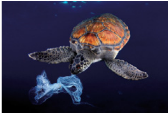
Fotografía de Sergi García Fernández, Premio de Honor en la temática de "Naturaleza" por "Tortugas de Armeñime".