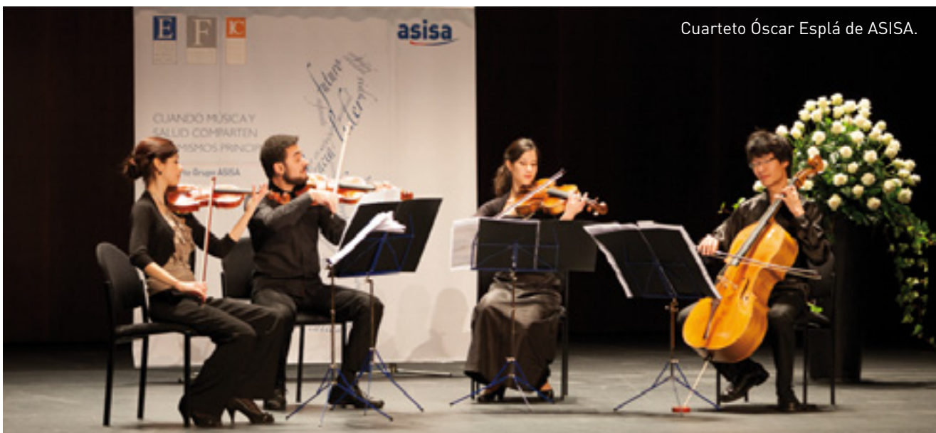
Cuarteto Óscar Esplá de ASISA.

Más información sobre la agenda artística y los próximos conciertos abiertos al público se puede consultar en la página web de la Fundación: www.fundacionalbeniz.com