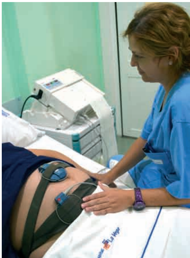
El Hospital La Vega ofrece un servicio completo para futuras mamás y papás.

El Hospital La Vega ha creado un paquete de asistencia integral al parto que consiste en una tarifa plana que