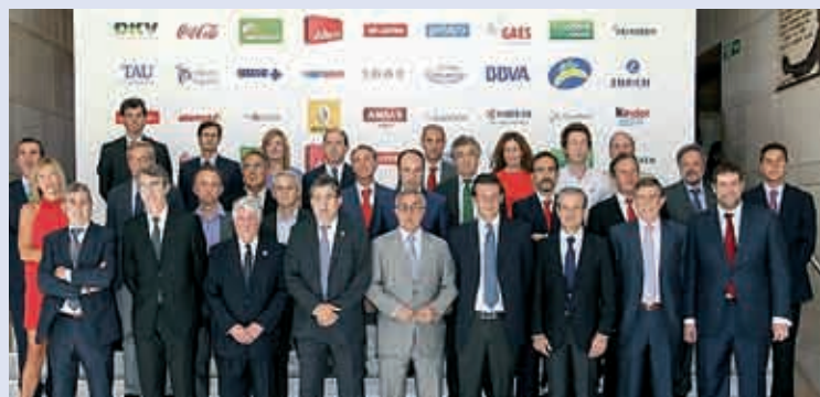
Los representantes de las empresas firmantes del Compromiso durante un foro para promocionar el acuerdo.

ASISA se ha unido al “Compromiso Empresarial por el Deporte Limpio”, que reconoce la importancia de la lucha contra el dopaje y la responsabilidad de los patrocinadores para mantener el “deporte limpio”.