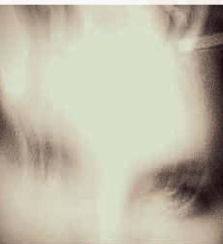
Una de las imágenes participantes en las ediciones anteriores: "Mujer", de Juan Carlos Aragón Congostrina.

El Certamen Internacional de Fotografía ASISAFoto mantiene el objetivo con el que nació: promover la cultura y el arte a través de la fotografía de autor y crear un archivo fotográfico que pueda compartir con los pacientes de ASISA a través de exposiciones itinerantes en las distintas clínicas de la compañía.