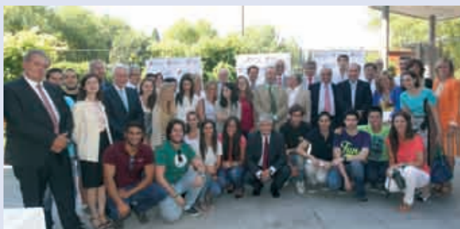
Foto de familia de los alumnos de Medicina de la Universidad Europea y los responsables de ASISA y el Hospital Moncloa.

La aseguradora refuerza su vinculación con la universidad y su apuesta por la formación de calidad.