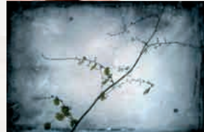
Premios de Honor de la anterior edición.