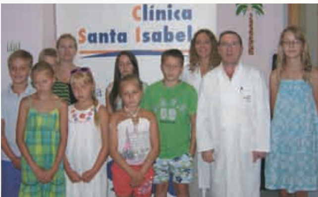
El equipo médico con niños bielorrusos que pasaron el reconocimiento en la Clínica Santa Isabel.

Además, las empresas de la economía social "operan en todos los sectores económicos; son de todos los tamaños, desde microempresas y pymes a grandes corporaciones mundialmente reconocidas, aunque no siempre se las asocia con el modelo de empresa de economía social al que pertenecen", explica el presidente de CEPES.