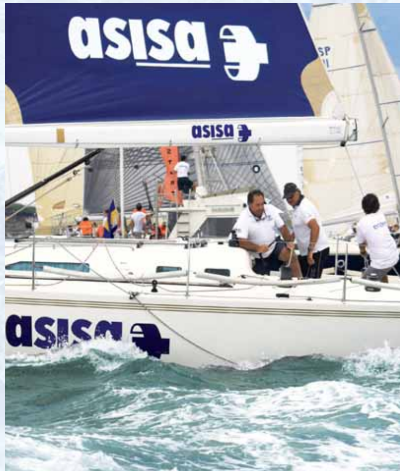
La embarcación de ASISA a pleno funcionamiento en una de sus últimas regatas.

llevo más de 20 años sin coger vacaciones más de siete días seguidos y que las dedico fundamentalmente a participar en regatas.