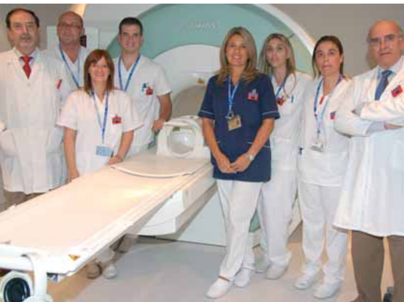
El equipo del Área de Diagnóstico por Imagen de Clínica Montpellier.

En cuanto a la colonoscopia virtual, permite explorar por medio de imágenes el interior del colon (intestino grueso) de modo que no es necesario recurrir a procedimientos más invasivos. La mayor parte de este tipo de pruebas se efectúan para buscar pólipos o cánceres en el intestino grueso.