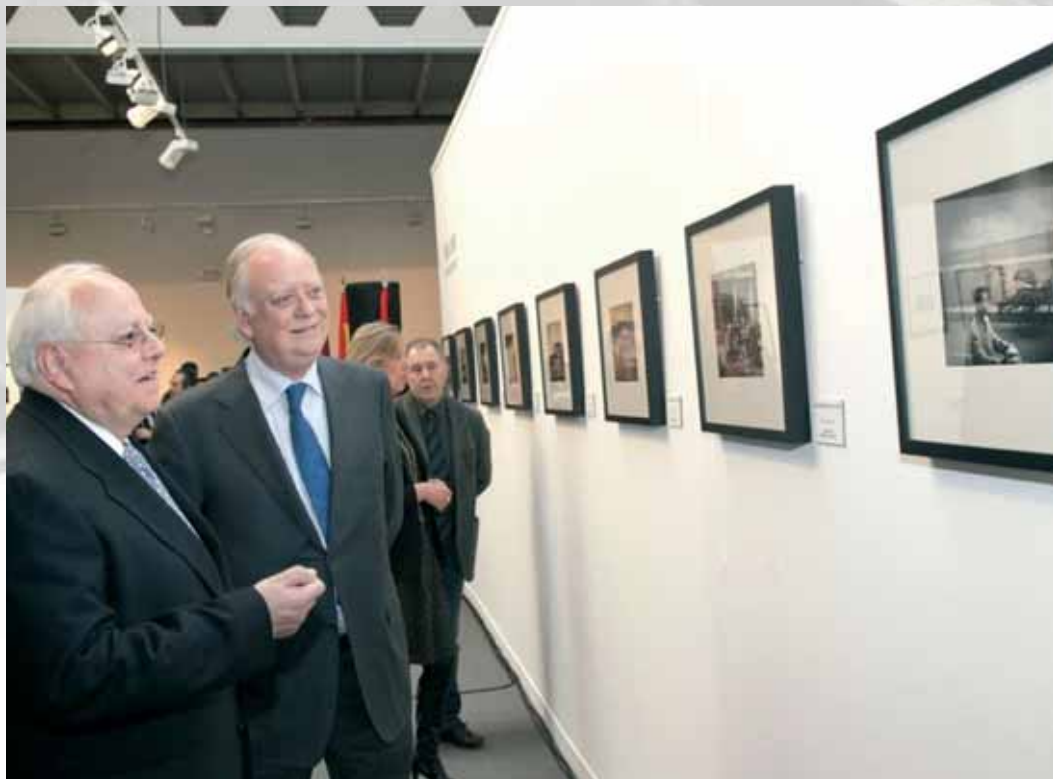
El presidente de ASISA contempla las fotografías galardonadas con Premio de Honor, dotado con 5.000 € y con la medalla de oro de la Confederación Española de Fotografía, en las categorías de temática "Libre", "Maternidad e infancia" y "Naturaleza".

Actualmente, el III Certamen Internacional de Fotografía ASISA es uno de los concursos de fotografía más importantes de España, tanto por el nivel de participación y el altísimo nivel de las obras presentadas como por la cuantía de los premios.